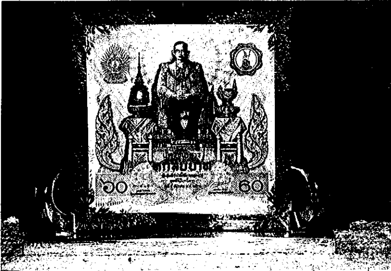
ทหารเกณฑ์

ในโอกาสที่พระบาทสมเด็จพระเจ้าอยู่หัวภูมิพลอดุลยเดชทรงมีพระชนมายุครบ ๖๐ พรรษา ในวันที่ ๕ ธันวาคม ๒๕๓๐ นี้ ธนาคารแห่งประเทศไทยได้ร่วมเฉลิมฉลองพระเกียรติอันยิ่งใหญ่นี้ โดยจะออก “บัตรธนาคาร” มีมูลค่าตามที่ตราไว้ฉบับละ ๖๐ บาท จำนวน ๙,๙๙๙,๙๙๙ ฉบับ คิดเป็นมูลค่ารวม ๕๙๙,๙๙๙,๙๔๐ บาท บัตรธนาคารนี้จะมีขนาดและรูปแบบแตกต่างไปจากขนาดของธนบัตรทั่วไป คือ มีขนาด ๑๕๙ x ๑๕๙ มิลลิเมตร และบัตรธนาคารนี้ก็ถือว่าเป็นธนบัตรที่ใช้ชำระหนี้ได้ตาม