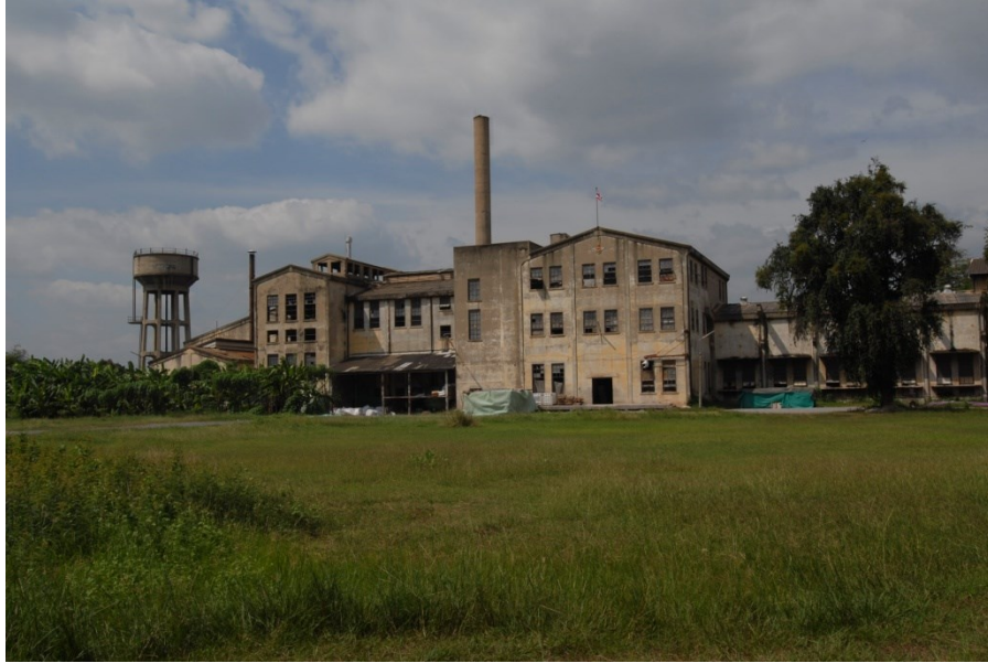
โรงงานกระดาษไทยจังหวัดกาญจนบุรีใน พ.ศ. 2550

การพิมพ์ธนบัตรในช่วงแรก ๆ นั้น ไม่ได้ราบรื่นเสียทีเดียว มีปัญหาในเรื่องเนื้อกระดาษ และการพิมพ์ที่ไม่สอดคล้องกัน เห็นได้จากในวันที่ 26 ธันวาคม พ.ศ. 2484 เริ่มทดลองพิมพ์ธนบัตร แบบพิเศษชนิดราคา 1 บาท (แบงก์กึ่งเต็ก) ต่อหน้าเจ้าหน้าที่กระทรวงการคลัง เมื่อพิมพ์ไปจำนวนหนึ่งพบว่า เส้นไหมที่โรยในเนื้อกระดาษหลุดออกมาฝังลงในแผ่นยางของแท่นพิมพ์เป็นจำนวนมาก แต่ยังไม่ยอมทดลองพิมพ์ต่อไปจนถึงแผ่นที่ 521 จึงระงับการพิมพ์ เพราะเห็นว่าหากขึ้นพิมพ์ต่อไป เครื่องพิมพ์จะเสียและจะใช้พิมพ์ธนบัตรต่อไปไม่ได้ ปัญหาเกิดจากเส้นไหมที่โรยมีขนาดใหญ่ บางเส้นใหญ่กว่าความหนาของเนื้อกระดาษ ได้จัดการแก้ไขโดยเรียกแม่กองทำกระดาษที่กาญจนบุรีมาตกลงกันว่า รอยที่จะใช้เส้นไหมโรยนั้นจะใช้เยื่อซึ่งยังไม่ได้ฟอกสะอาด (สีกากี) โรยแทนเส้นไหม ขนาดกว้างประมาณ 5 มิลลิเมตร (เยื่อที่โรยนี้จะเห็นเป็นรอยจาง ๆ ตามแนวตั้งของธนบัตร ใช้เป็นจุดสังเกตการณ์ปลอมแปลงได้ กระดาษที่พิมพ์ไม่มีลายน้ำ แต่ใช้วิธีการทำลายคุณนูนรูปพานรัฐธรรมนูญ ในวงรีสีขาวด้านขวาของธนบัตร) ได้สั่งการให้เริ่มลงมือทำเมื่อวันที่ 27 ธันวาคม พ.ศ. 2484 กระดาษใหม่จะได้ประมาณวันที่ 29 และจะใช้พิมพ์ตั้งแต่วันที่ 30 ธันวาคมเป็นต้นไป ธนบัตรแบบพิเศษชนิดราคา 1 บาท (แบงก์กึ่งเต็ก) ซึ่งเป็นธนบัตรแบบแรกที่ยกแบบและจัดพิมพ์ในไทย ได้ประกาศออกใช้เมื่อวันที่ 25 มกราคม พ.ศ. 2485