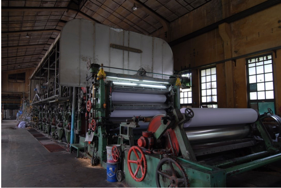
เครื่องทำกระดาษที่ใช้มาตั้งแต่สงครามโลกครั้งที่ 2 ปัจจุบันมีการปรับปรุงและยังคงใช้งานอยู่

กรมคลังสั่งพิมพ์ธนบัตรแบบพิเศษชนิดราคา 1 บาท (แบงก์กึ่งเด็ก) ครั้งแรกในเดือน ธันวาคม พ.ศ. 2484 จำนวน 3,000,000 ฉบับ กรมแผนที่ทหารบกพิมพ์เสร็จและเริ่มส่งให้ กรมคลังตั้งแต่วันที่ 20 มกราคม พ.ศ. 2485 และจะส่งได้หมดภายในสิ้นเดือนกุมภาพันธ์ พ.ศ. 2485 ซึ่งคงจะใช้แลกเปลี่ยนในเวลาไล่ ๆ กัน ส่วนธนบัตรที่สั่งจากญี่ปุ่นกว่าจะได้รับก็ราวกลางเดือนมีนาคม พ.ศ. 2485 ระหว่างต้นถึงกลางเดือนมีนาคม พ.ศ. 2485 ธนบัตรจะขาดมือไม่มีรับแลก ดังนั้น เพื่อ ประสงค์การรับแลกจึงขอเพิ่มจำนวนพิมพ์ และในวันที่ 23 กุมภาพันธ์ พ.ศ. 2485 ก็ได้รับอนุมัติจาก จอมพล ป. พิบูลสงคราม นายกรัฐมนตรีให้พิมพ์ธนบัตรแบบพิเศษชนิดราคา 1 บาท (แบงก์กึ่งเด็ก) เพิ่มอีก 2,000,000 ฉบับ จากเดิมที่อนุมัติไว้ 3,000,000 ฉบับ รวมเป็น 5,000,000 ฉบับ